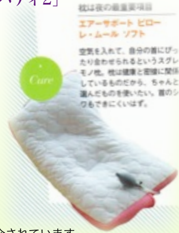
38ページに紹介されています。